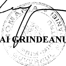
SORIN MIHAI GRINDEANU